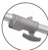
ARBRE EN ALUMINIUM SÉPARABLE À FERMETURE RAPIDE À GLISSIÈRE