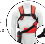
KOMFORT-DOPPEL SCHULTERGURT FÜR FREISCHNEIDER- U. TRIMMER-AUFSATZ