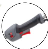
RÉGULATEUR DE VITESSE ÉLECTRONIQUE

CHAÎNE OREGON MICRO-LITE d'une largeur utile de 1,1 mm et d'un pas de 3/8 "LP. Pour une plus longue durée de vie de la batterie et une coupe plus rapide et plus nette.