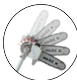
ADAPTATION DE TRONÇONNEUSE À 5 POSITIONS JUSQU'À 90