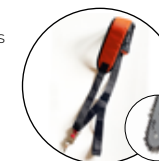
KOMFORT-SINGLE SCHULTERGURT FÜR KETTENSÄGEN- U. HECKENSCHEREN-AUFSATZ