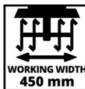
WORKING WIDTH 450 mm