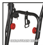
CABLE STRAIN RELIEF