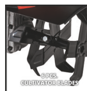
6 PCS. CULTIVATOR BLADES