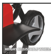
HEIGHT ADJUSTABLE WHEELS