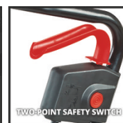
TWO-POINT SAFETY SWITCH