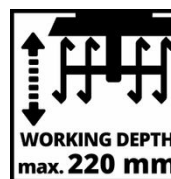
WORKING DEPTH max. 220 mm