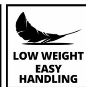
LOW WEIGHT EASY HANDLING